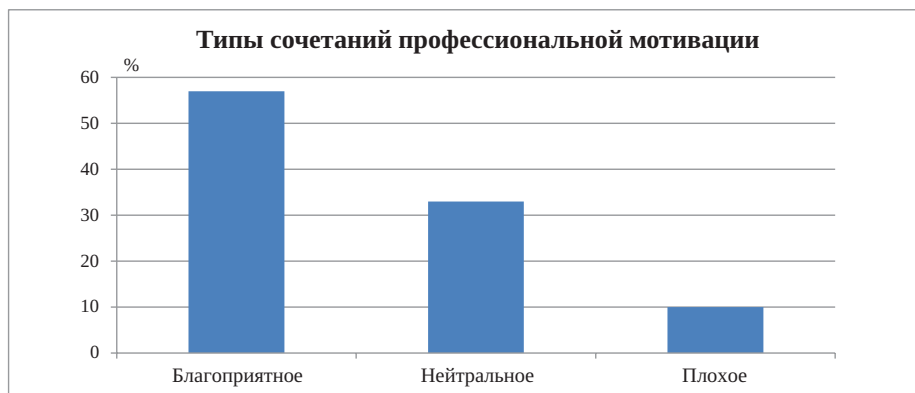
Рис. 3. Типы сочетаний профессиональной мотивации, %

• создание программы по улучшению здоровья работников.