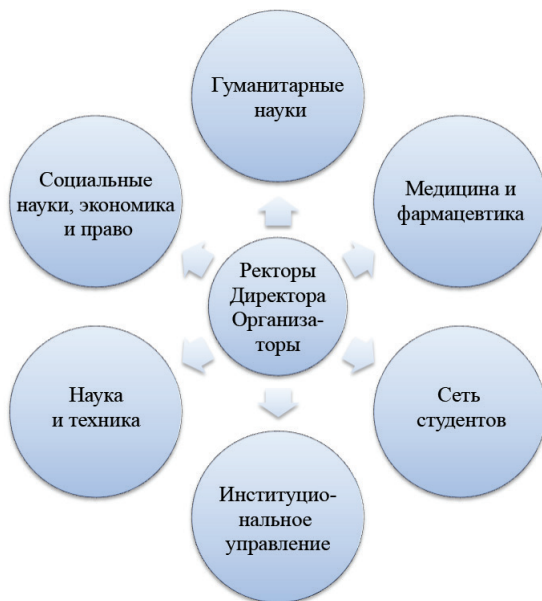
Рис. 2. Схема сотрудничества в рамках сети U4

Сеть U4 в целом управляется четырьмя ректорами, которые определяют общую