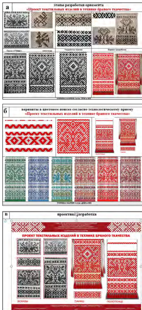
Рис. 2. «Проект текстильных изделий в технике браного ткачества». Учебная работа 4-го курса ДПИ, в которой представлены три этапа работы над проектом: