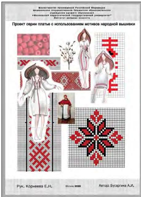
Рис. 3. Учебная работа «Проект с использованием мотивов народной вышивки» учебная работа 2-го курса ДПИ