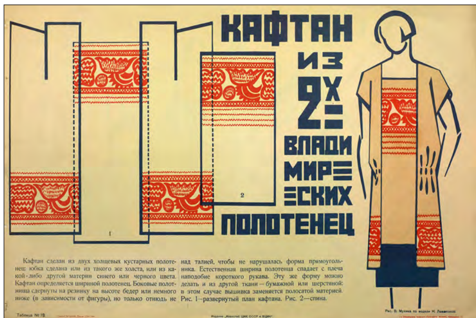
Рис 1. Таблица № 19. «Кафтан из 2-х владимирских полотенец». Рисунок В. Мухина по модели Н. Ламановой [3]

В качестве влияния декоративно-прикладного искусства на дизайн можно привести яркий пример моделей одежды Н. Ламановой (рис.1). А эталоном в обучении могут служить таблицы «Искусство в быту» – 36 таблиц (1925) [3]. Каждая из таблиц составлена в расчете на практическое осуществление заключающегося в ней чертежа. В этих целях редакция в данном