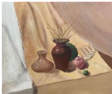
Рис. 3. Эскиз. Чжан Янци