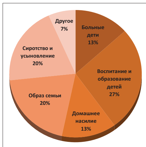
Рис. 1. Тематическое многообразие публикаций о проблемах семьи в журнале «Русский репортер»