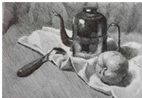
Рис. 2. Курсовая работа по базовому рисунку китайской студентки первого курса бакалавриата МПГУ