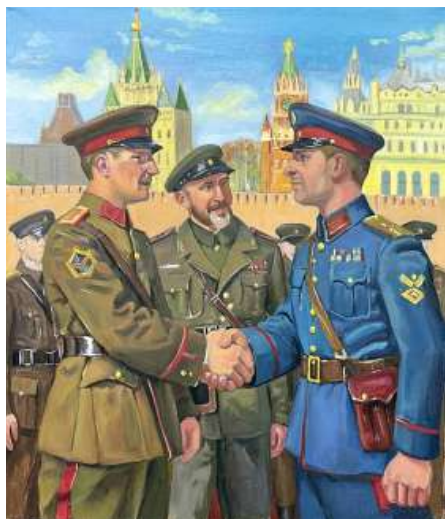
Рис. 4. «Мир», 2025 г., масло, 60 × 70 см

После перевода в МПГУ и прохождения обучения в рамках компонентов «аудитория» и «музей» (2024–2025) студенты в своих учебных работах демонстрируют прорыв в творческом наблюдении: мазок переходит от «копирования» к активному «конструированию», а понимание света и тени и структуры приобретает более обобщенный и выразительный характер (рис. 4–6). Однако то, как преобразовать это прорывное умение наблюдать и культурное обогащение, полученное в музеях, в творческие работы, способные к глубокому синтезу, зависит от ключевого звена «трехмерной модели преподавания» – тематического творчества.