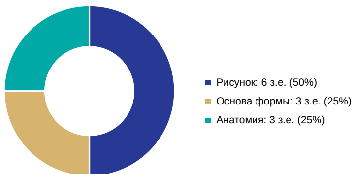
Рис. 1. Структура кредитов в совместной российско-китайской образовательной программе по изобразительному искусству

СОП № 2 (Совместная образовательная программа № 2): всего 12 зачетных единиц (з.е.)