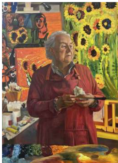
Рис. 8. «Жизнь Зураба Церетели», 2025 г., масло, 130 × 105 см

Выпускная работа китайского студента наглядно демонстрирует проникновение в российскую художественную школу (рис. 7–8). Живописная композиция преодолевает копировальный подход, демонстрируя успешный индивидуальный стиль и реализацию персонализированного художественного образа в межкультурном контексте.