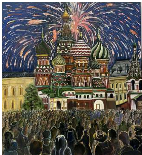
Рис. 5. «Великая Победа», 2025 г., масло, 90 × 100 см