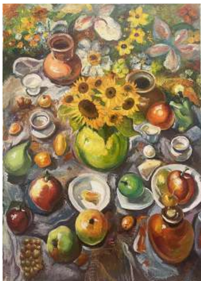
Рис. 7. «Натюрморт», 2025 г., масло, 50 × 70 см

Тематическое творчество как заключительный этап модели имеет своей основной педагогической задачей направлять студентов к переходу от «культурного заимствования» к «творческому культурному синтезу». Этот процесс реализуется через строгую методику преподавания: на этапе постановки задачи и концептуализации преподаватель формулирует открытую тему, требуя от студентов четко артикулировать в предложении, как их работа откликается на традиции китайского и русского искусства. Посредством индивидуальных консультаций первоначальные упрощенные решения студента приобретают более глубокое осмысление культурной логики, стоящей за внешней формой.