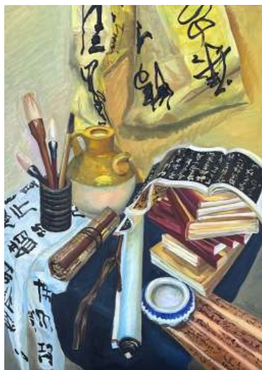
Рис. 6. «Картина маслом натюрморт, зарисовка кабинета», 2024 г., масло, 50 × 70 см