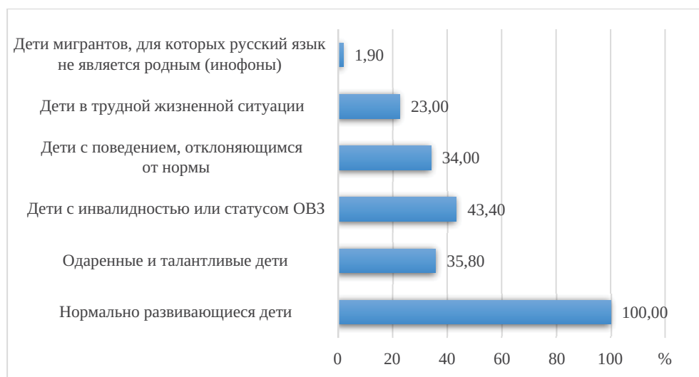
Рис. 2. Группы подростков (социально уязвимые и благополучные), с которыми работают или приходилось работать респондентам, %