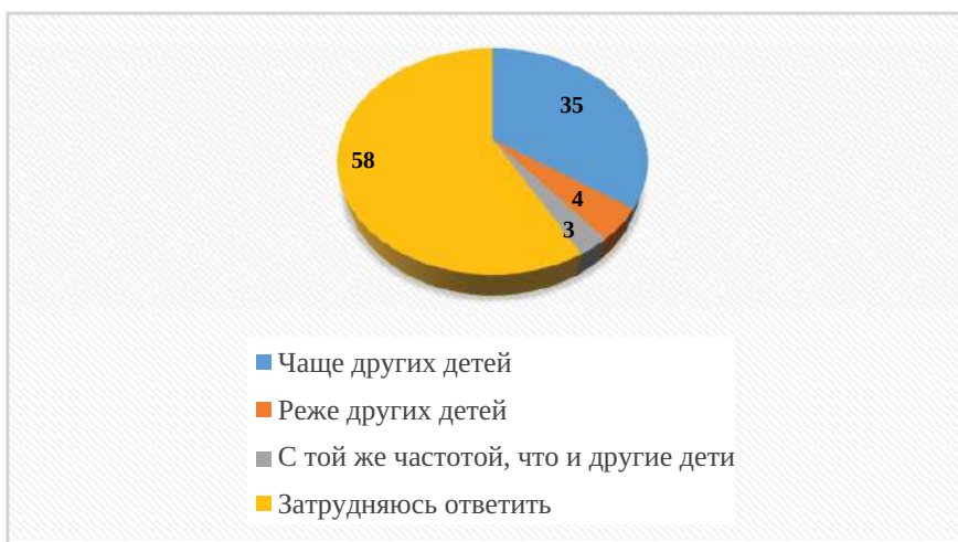
Рис. 3. Мнение учителей о распространенности проблем школьной адаптации у подростков с трудностями учебных коммуникаций, %

более распространенные, по мнению учителей, трудности учебных коммуникаций, встречающиеся у социально уязвимых групп подростков, представлены в табл. 6, где они ранжированы по степени распространенности. По каждой трудности приведены первые две по степени распространенности (по мнению учителей) социально уязвимые группы подростков.